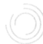
Table des matières