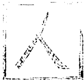
TABLEAU DES VARIATIONS DES CAPITAUX PROPRES