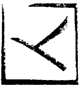
TABLEAU DES FILIALES ET PARTICIPATIONS